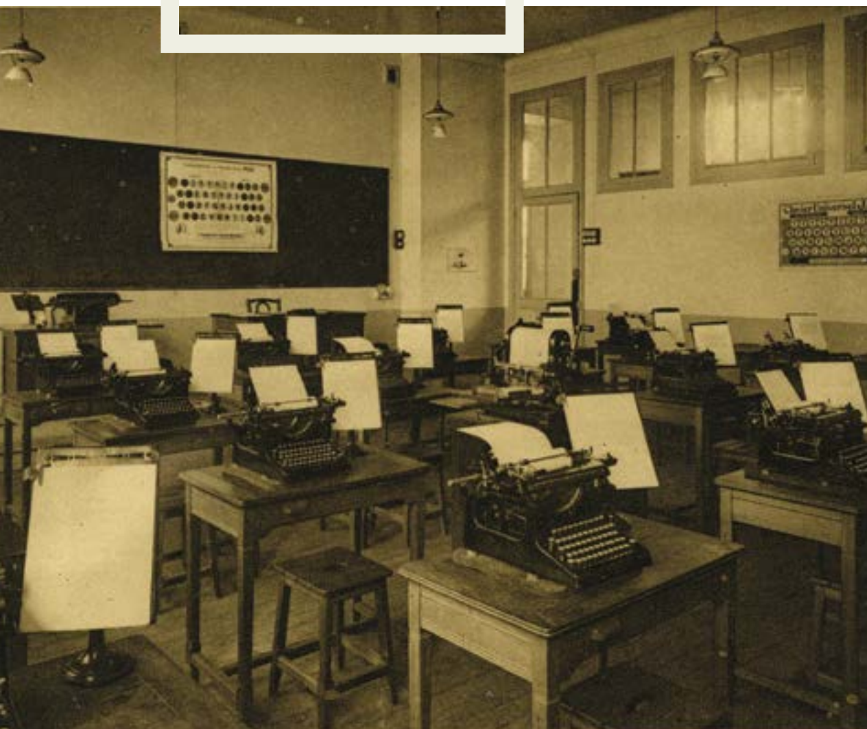
Saint-Ouen. École nationale professionnelle, salle de dactylographie

L'objectif des ateliers « Découverte des archives » est de sensibiliser aux documents d'archives. Les élèves apprennent à sélectionner l'information et à la hiérarchiser avant de la retranscrire sous forme de journal, de courriers ou de fiction.