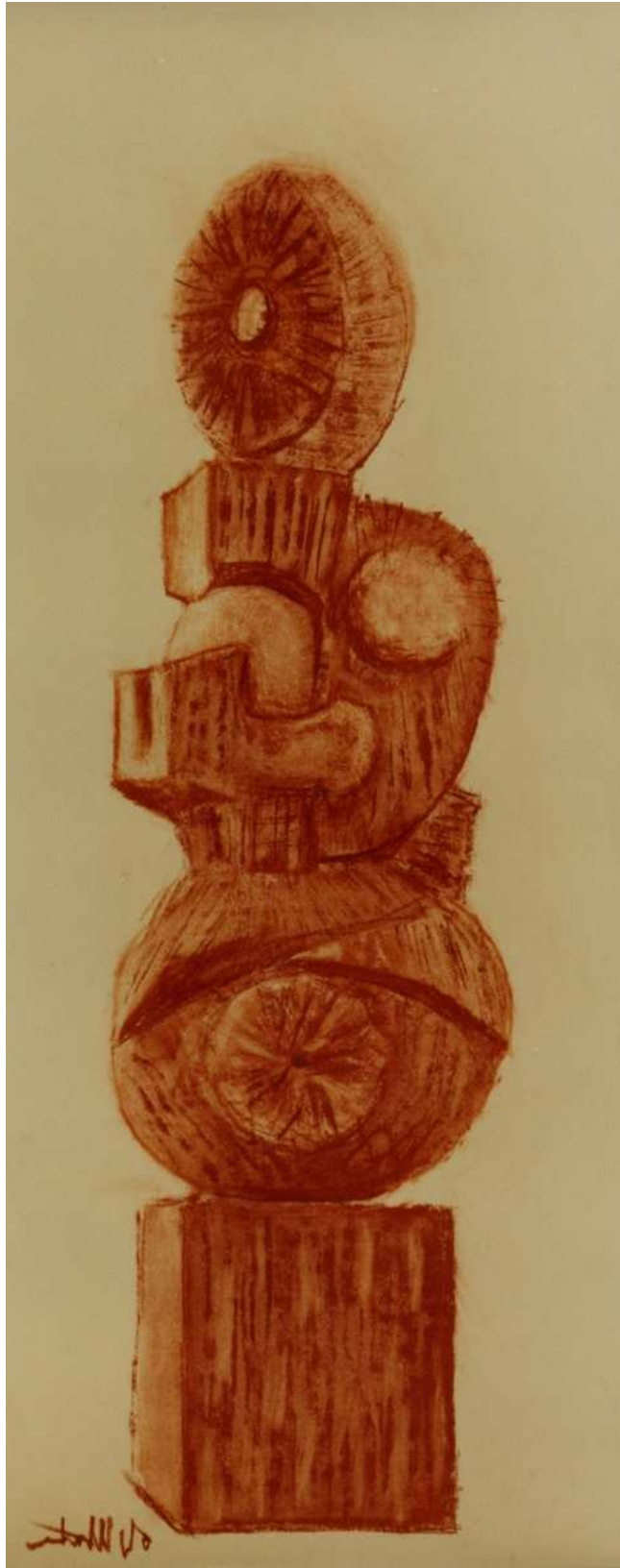
Esquisse de la sculpture, Gaetano di Martino, sd. (sc.)