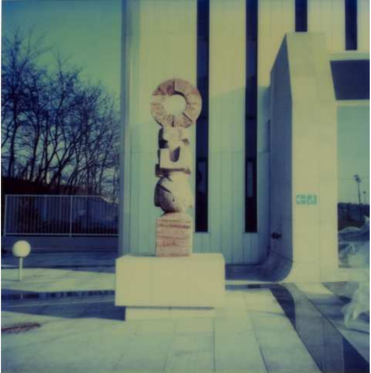
Le Scribe, de Gaetano di Martino, sur le parvis des Archives départementales de la Seine-Saint-Denis, janvier 1984 (sc.)