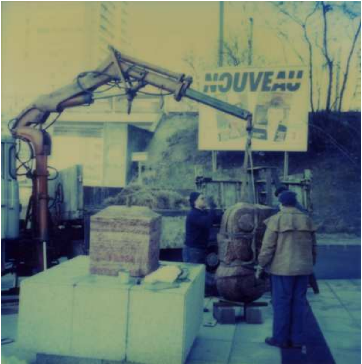
Installation de la sculpture sur le parvis des Archives départementales, janvier 1984 (sc.)