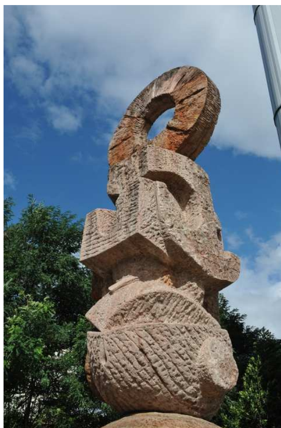
Le Scribe, de Gaetano di Martino, septembre 2012